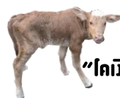
“โคเงินล้าน” นำร่อง ระยะที่ ๑

๒) เมื่อดำเนินงานโครงการครบทุก ๑ ปี (ภายในระยะเวลาไม่เกิน ๕ ปี) หรือเมื่อสิ้นสุดโครงการ ให้กองทุนหมู่บ้านและชุมชนเมืองรายงานผลความก้าวหน้าการดำเนินงานโครงการ ปัญหา/อุปสรรค ข้อเสนอแนะ ให้ สทบ. หรือตามกรอบระยะเวลาที่คณะกรรมการขับเคลื่อนการดำเนินโครงการ “โคเงินล้าน” นำร่อง ระยะที่ ๑ ระดับสาขาเขต กำหนด (แบบโคเงินล้าน ๐๘)